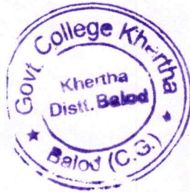
प्राचार्य, शासकीय महाविद्यालय, खेरथा: जिला बालोद (छ. ग.)